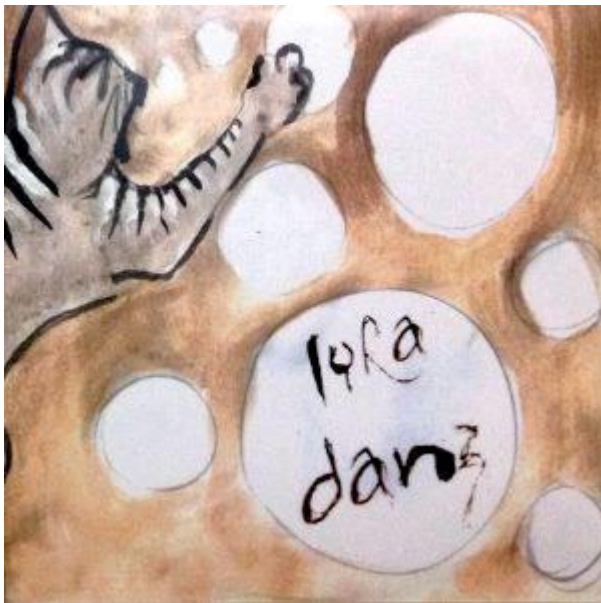
LyraDanz, 2013 (EP)